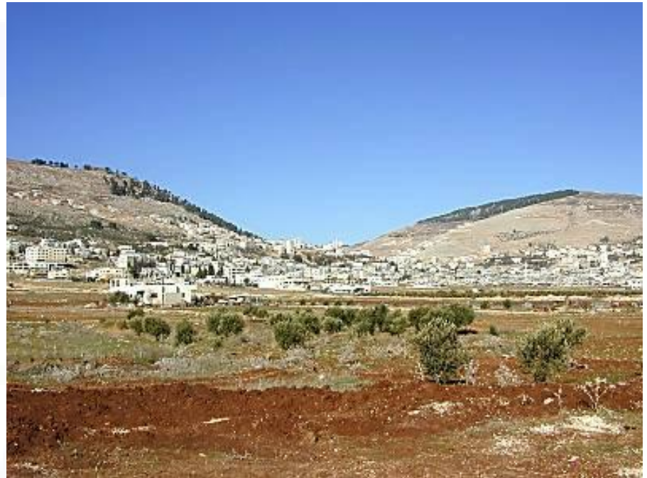
Monte Gerizim y Monte Ebal vistos desde el Este. Valle de Shejem