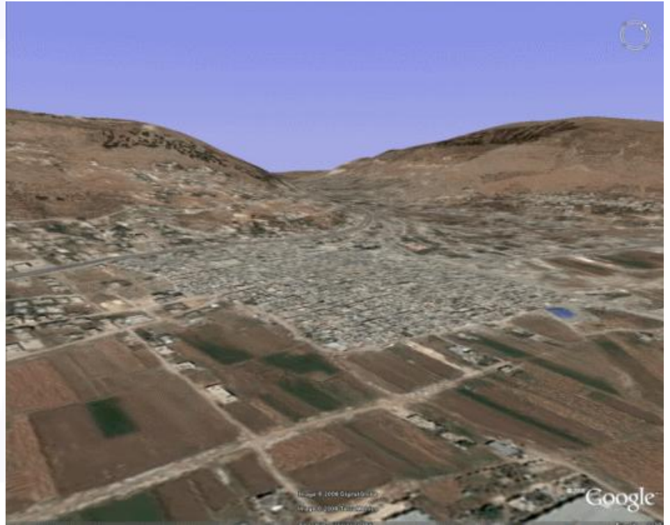
Monte Gerizim y Monte Ebal