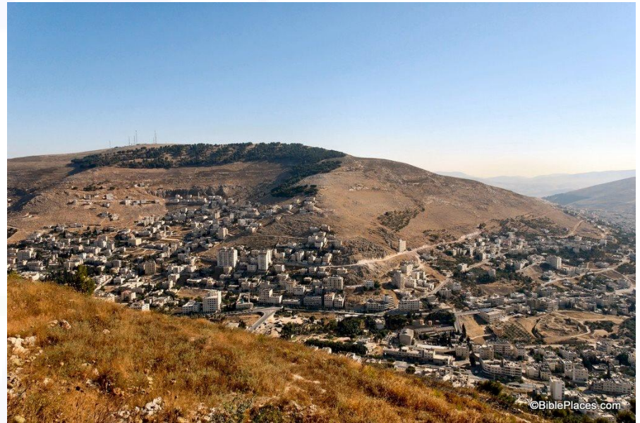
Monte Ebal visto desde el Monte Gerizim